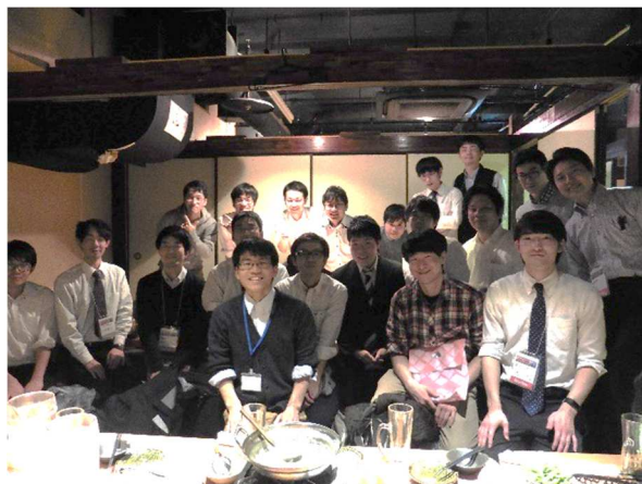
図2 交流会後の集合写真。