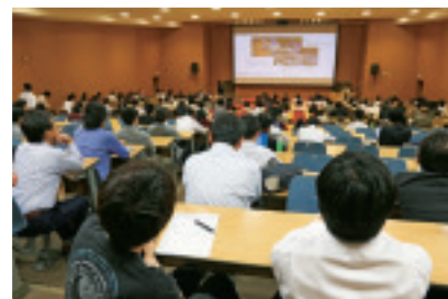
秋季講演会第 80 回記念シンポジウムの講演風景。