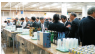
懇親会場。北海道の日本酒・地ビール利き酒コーナーの様子。

今講演会も例年同様、口頭講演、ポスター講演のほかに、基礎から応用までを短時間で学べるチュートリアルを 5 件実施しました。