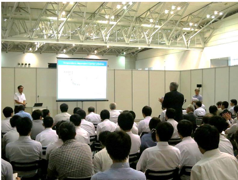
活発な質疑応答がなされた

今回のシンポジウムの聴講者は 100 名を超え、それぞれの講演に対して幅広い活発な質疑応答がなされた。前述のように、多元系化合物太陽電池を中心としながらも評価技術を軸として分野の枠を超えた内容となったため、「13.10 化合物太陽電池」セッションの参加者だけでなく、他領域の参加者にとっても有意義なものであったと考えられる。今後もこのような分野の垣根を越えた知の交流が活発になされることによって本研究分野がさらに発展していくことを願う。最後に、本シンポジウムにおいて最新的话题を提供して下さった講演者ならびに活発な議論に参加していただいた聴講者の方々に感謝の意を表す。