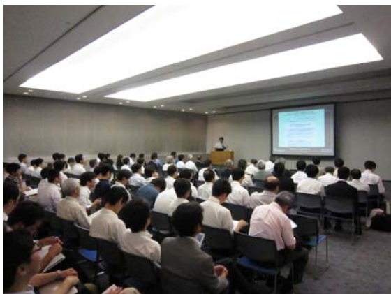
図3. シンポジウムの様子