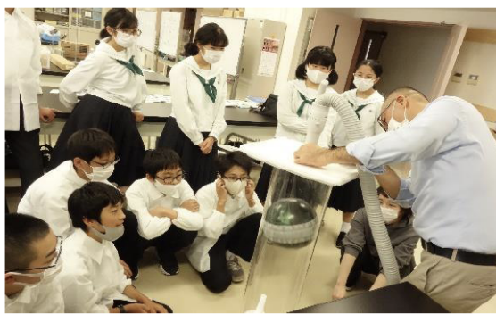
大気圧でボウリングの球を空中浮揚