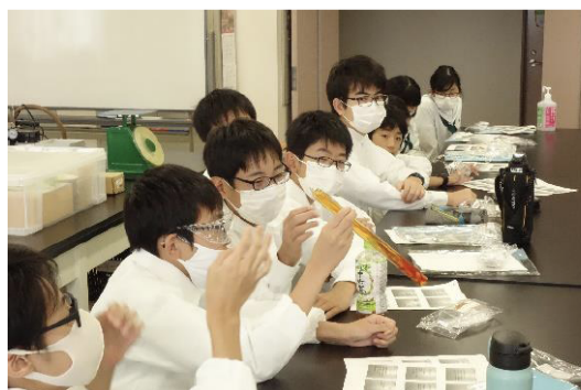
臭素の状態変化を観察する様子