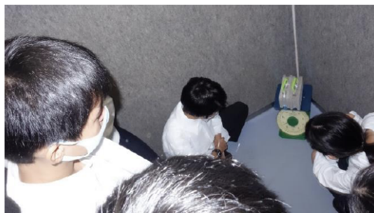
エレベーター内で物体の重さの変化を調べる様子