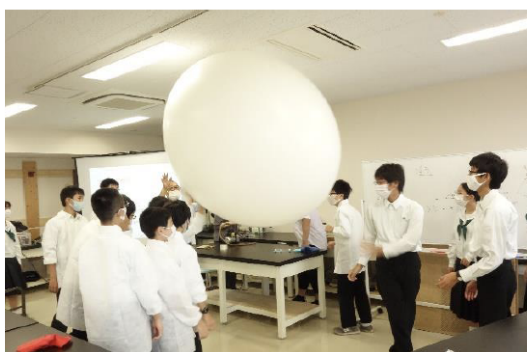
ジャイアントバルーンで空気の質量を実感